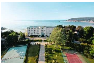
«Le Grand Hôtel de la Mer»