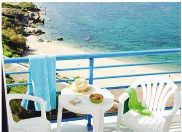
Privilège – Propriano, Korsika