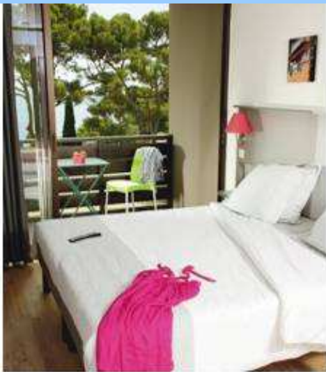
Premium – Presqu'île de Giens