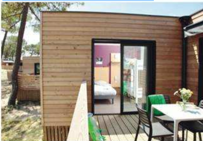
Premium Bungalow – Capbreton